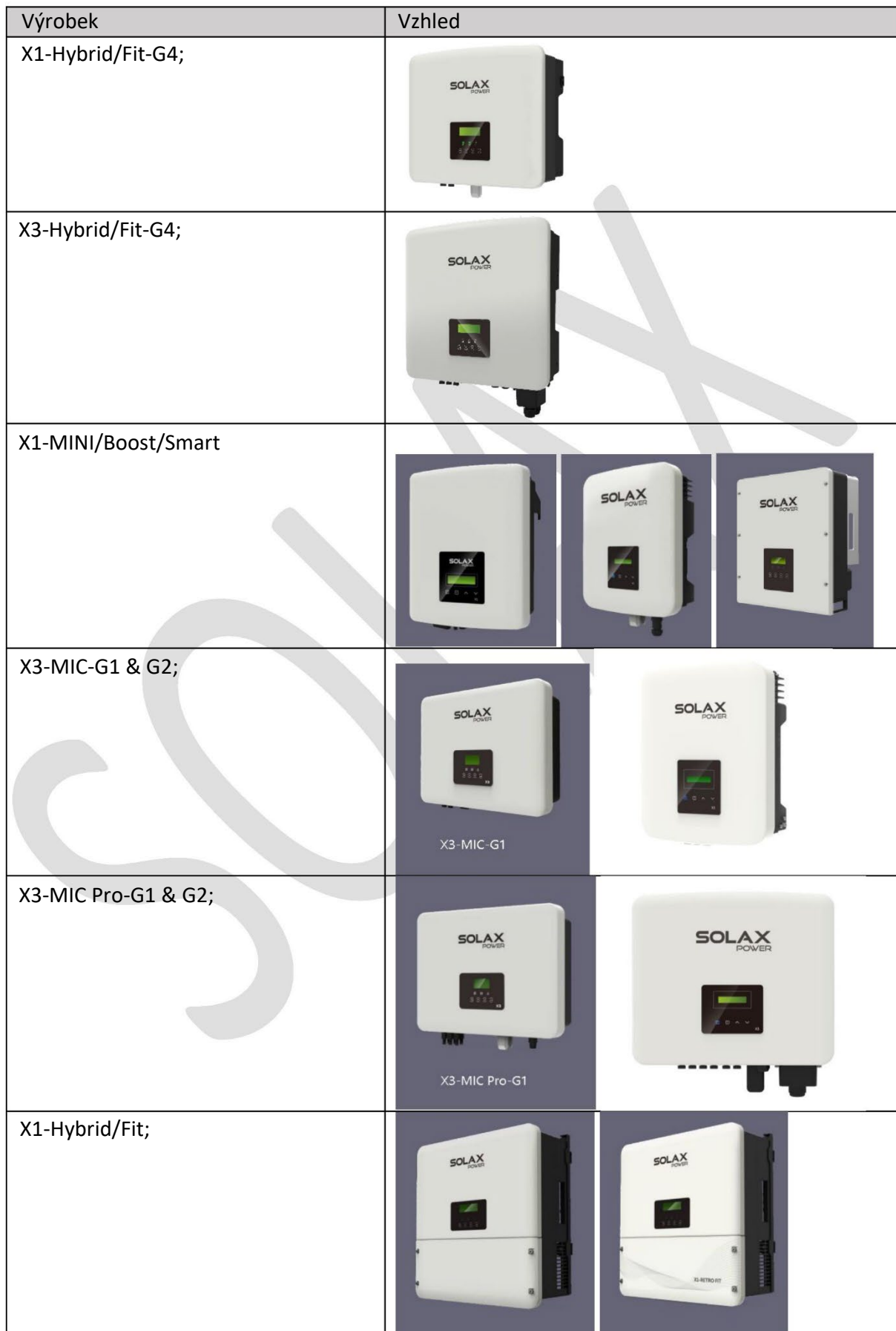
Tabulka 2: Výrobek a vzhled