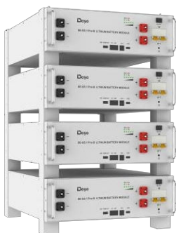
Montáž na podlahu