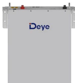
Montáž na stenu