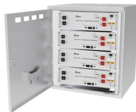
Montáž na stojan